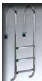
Scaletta Ladder- Echelle - Hochbeckenleiter