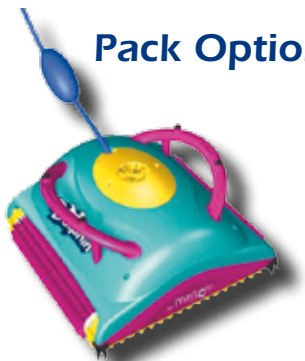
Pulitore automatico Cleaner robot - Robot aspirateur - Reinigungsrobot