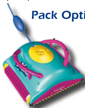
Pulitore automatico Cleaner robot - Robot aspirateur - Reinigungsrobot