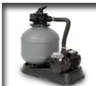
Gruppo Filtrante a sabbia Sand filter group - Groupe de filtration à sable - Sandfilteranlage